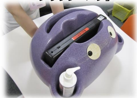
手洗いチェック検査器 「グリッターパグ」