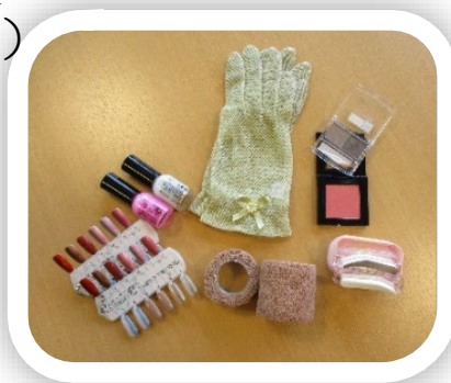
手軽に使えるケア用品や ウィッグをご紹介します！

内容：①紙芝居を使った副作用対策のお話 (30分) ②ウィッグなどケア用品のお試しタイム (30分)