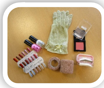
手軽に使えるケア用品や ウィッグをご紹介します！

内容：①紙芝居を使った副作用対策のお話(30分) ②ウィッグなどケア用品のお試しタイム(30分)