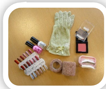
手軽に使えるケア用品や ウィッグをご紹介します！

講師：国立がん研究センター アピアランス支援センター主催の 研修を修了したスタッフ