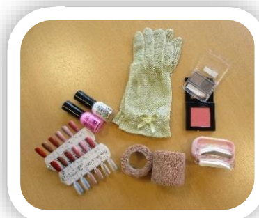
手軽に使えるケア用品や ウィッグをご紹介します！

講師：国立がん研究センター アピアランス支援センター主催の 研修を修了したスタッフ