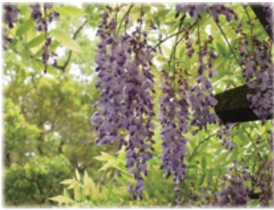
天赦園 (宇和島市)

予…予約のみ ○…午前のみ △…午後のみ ★…奇数週 ☆…偶数週 (化)…化学療法担当 (内)…内視鏡治療担当 ※診療担当は変更する場合がありますので、事前にご確認ください。