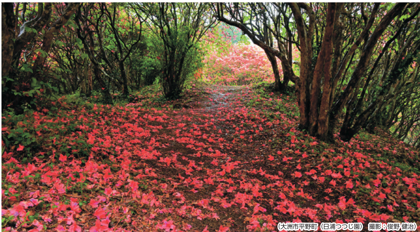
(大洲市平野町 (日浦つづじ園))

基本理念 患者さんの立場にたち人格を尊重し、科学と信頼に基づいた最良のがん医療を提供します。