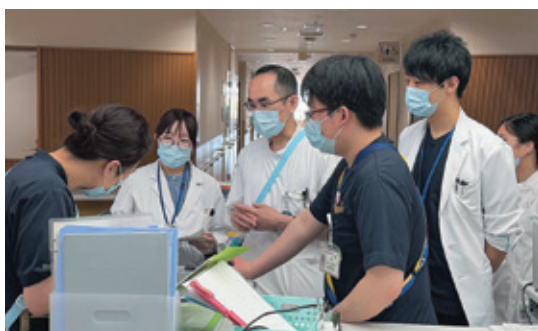
院内ラウンド（抗菌薬適正使用ラウンド）