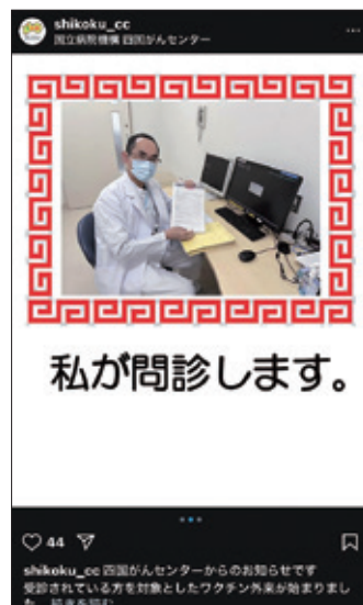
四国がんセンターInstagramに掲載したワクチン外来のお知らせ