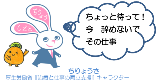
ちりょうさ 厚生労働省『治療と仕事の両立支援』キャラクター